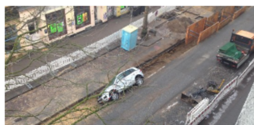
03.02.2014 STERNESCHANZE Verfahren? Auto landet in Baugruben