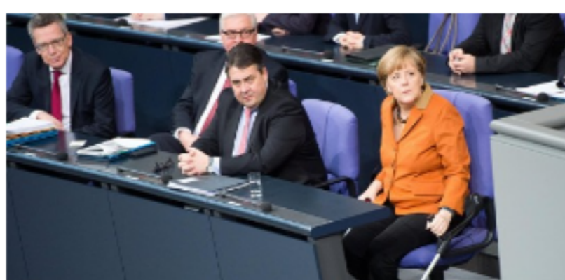
03.02.2014 SNOWDEN ALS ZEUGE? Datenschützer wollen Ermittlungen gegen Merkel und de Maizièere